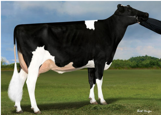
IHG LOTTOMAX TANIA DAM